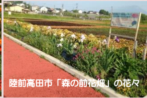
陸前高田市「森の前花畑」の花々