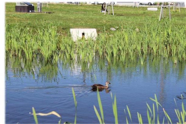
トンボ池とカルガモ

この広場は、自然環境の保全や地球資源の大切さなどを体験しながら学べる場として整備したものです。どなたでも自由に利用できます。