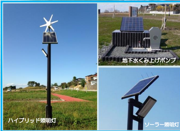
ハイブリッド照明灯