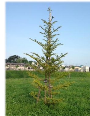
ウラジロモミ (エコアス広場のシンボルツリー)