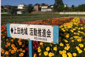
植栽いただいた花々