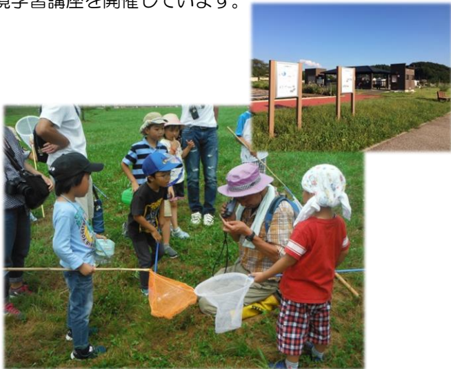
環境学習講座のようす

また、自然環境の保全、循環型社会の形成及び再生可能エネルギーの利用に対する理解を深めるため、環境学習講座を開催しています。