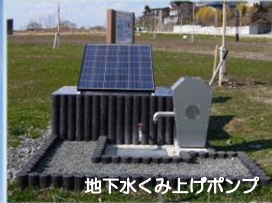
地下水くみ上げポンプ