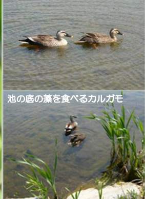
池の底の藻を食べるカルガモ