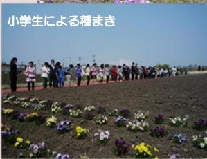
小学生による種まき