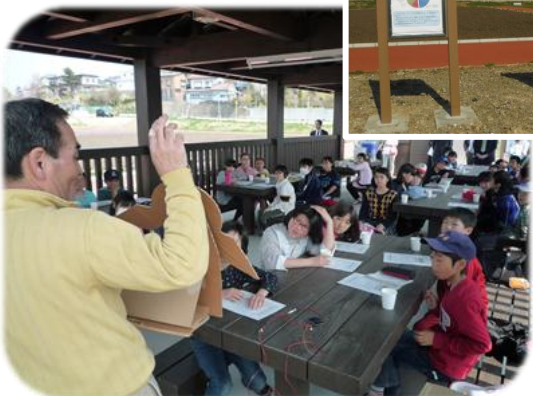
自然環境とエネルギーについて学んでいるようす