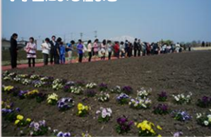
小学生による種まき