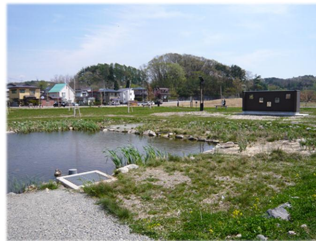
トンボ池と観察所

この広場は、自然環境の保全や地球資源の大切さなどを体験しながら学べる場として整備したものです。どなたでも自由に利用できます。