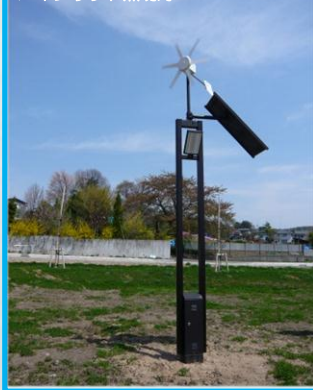
ハイブリッド照明灯

太陽光や風力を利用した照明灯や、人工池に地下水をくみ上げるポンプがあります。再生可能エネルギーについて学ぼう！