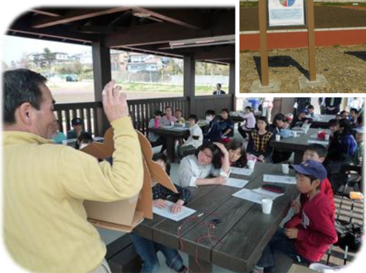
自然環境とエネルギーについて学んでいるようす