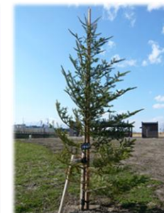
ウラシロモミ (エコアス広場のシンボルツリー)