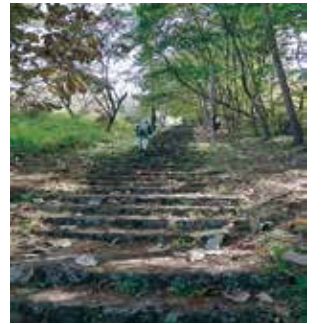
石段を上がり岩山山頂へ