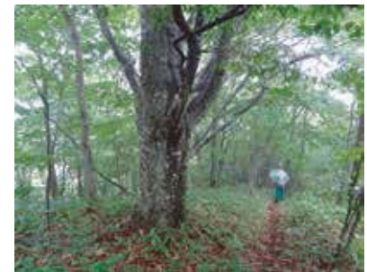
山頂付近のブナ大木