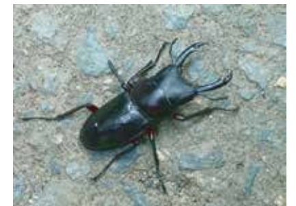
アカアシクワガタ