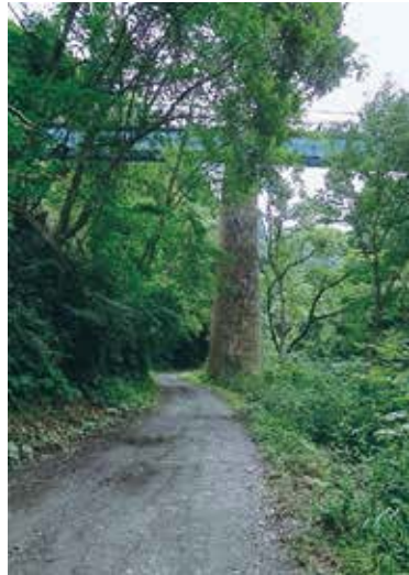
JR 山田線の古い鉄橋の下を通る