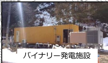
バイナリー発電施設